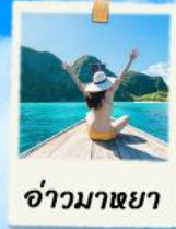
อ่าวมาหยา