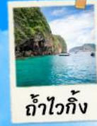
ถ้าไวก็ง